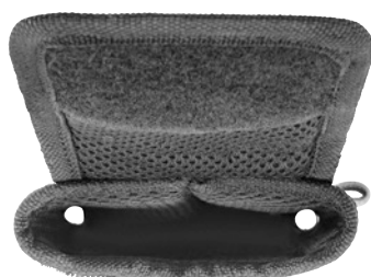
Артикул 0715 930 221/241