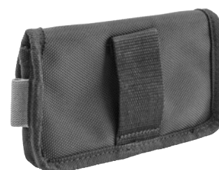
Артикул 0715 930 220

Показанные на иллюстрациях инструменты в комплект не входят.