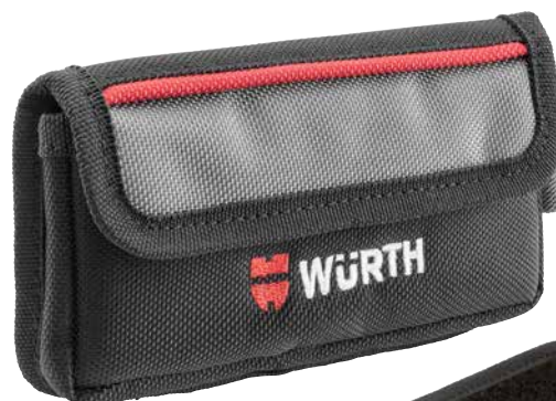
Артикул 0715 930 220