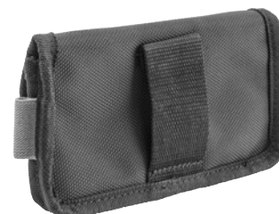
Артикул 0715 930 220

Показанные на иллюстрациях инструменты в комплект не входят.