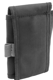
Артикул 0715 930 221/241