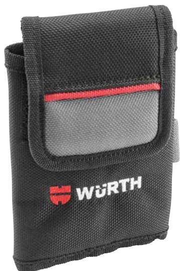
Артикул 0715 930 221/241