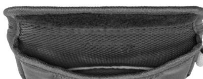
Артикул 0715 930 220