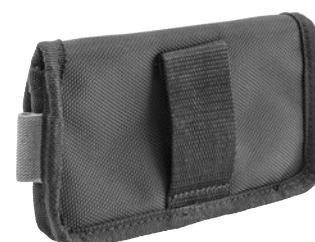
Артикул 0715 930 220