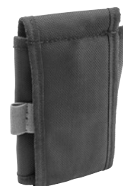
Артикул 0715 930 221/241