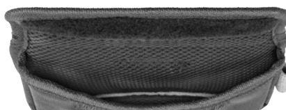
Артикул 0715 930 220