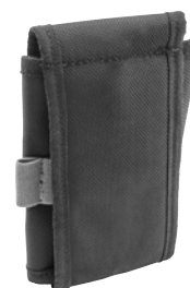
Артикул 0715 930 221/241