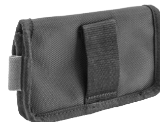
Артикул 0715 930 220