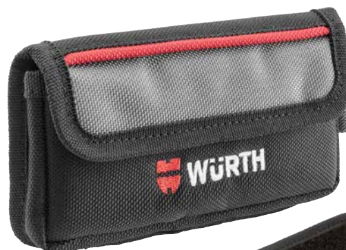
Артикул 0715 930 220