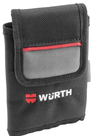
Артикул 0715 930 221/241